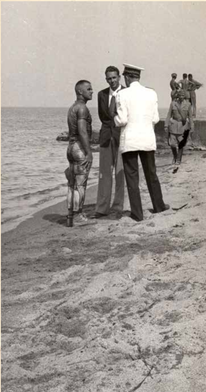
Carquines - agosto 1942 - prove di lancio in mare - l'esperto non mi si è aperto il paracadute! - Alman. Bus - Noek - Usa - Podanese -