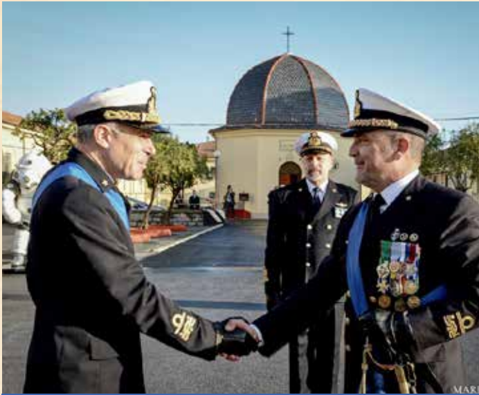
AVVICENDAMENTO DI AMMIRAGLI