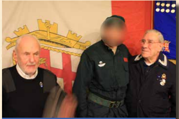
SERRA, OP. "GOI", PANIGHINI