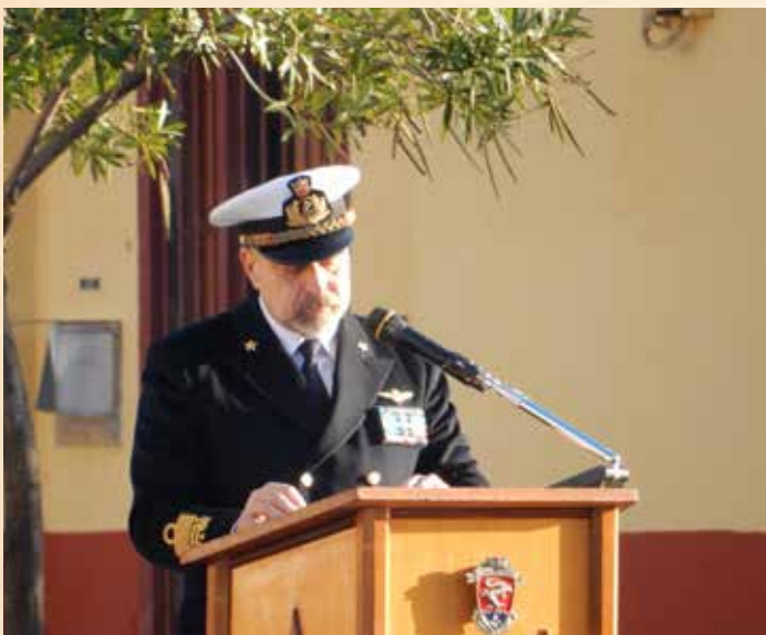
IL CAPO DI STATO MAGGIORE