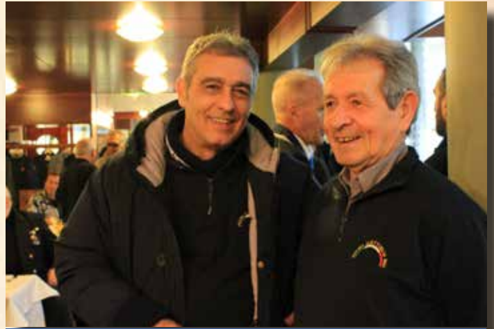
CONTI E MONTINI