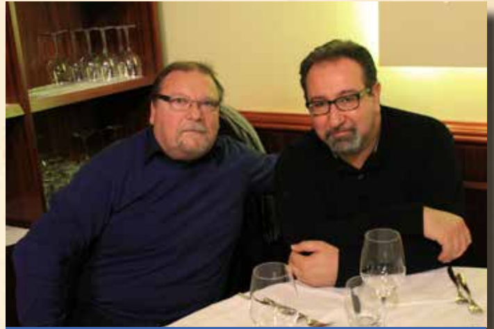
BRIANI E CAP. IDI