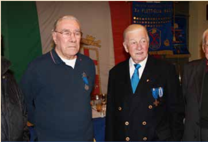
PANIGHINI E MASCIADRI