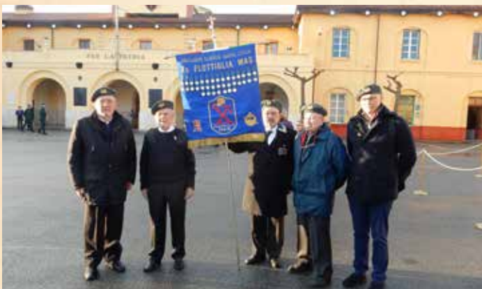
GLI ASSOCIATI PRESENTI