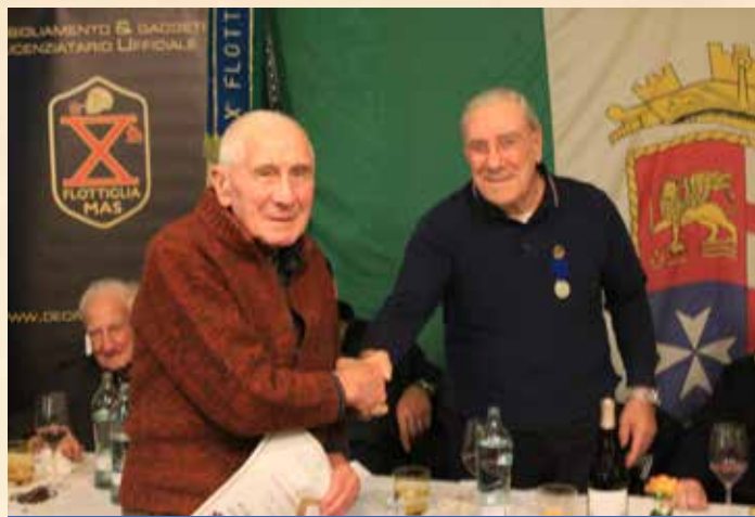
RPARA' MURELLI: DISTINTIVO D'ONORE 2015