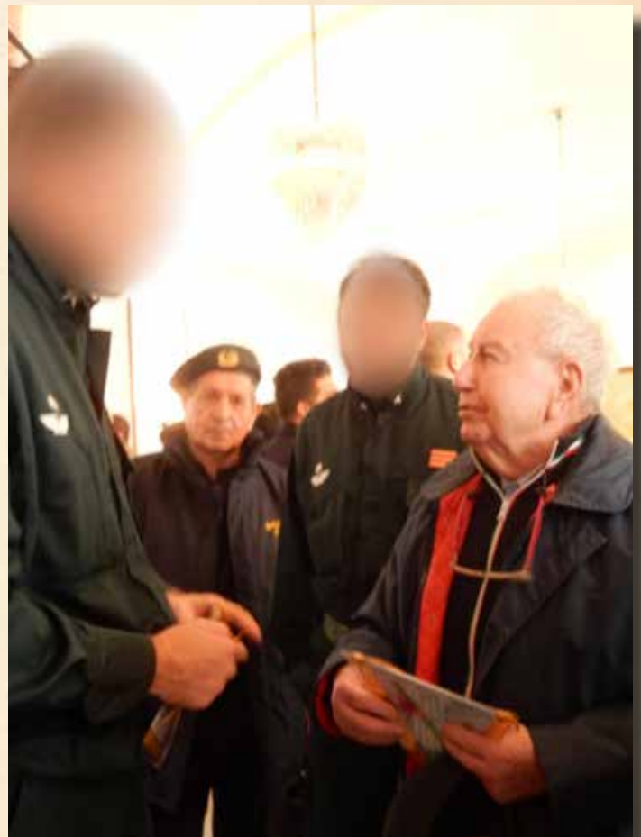
IL COM.TE DEL "GOI" ED IL PRESIDENTE