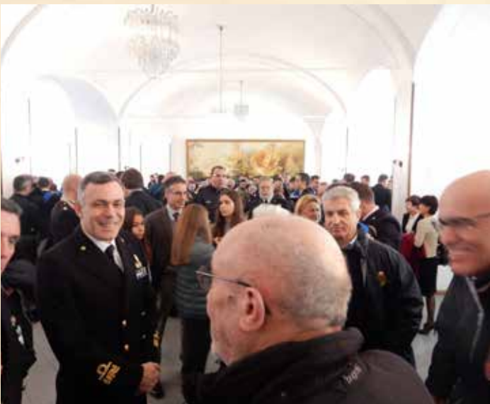
MOMENTI DEL RICEVIMENTO