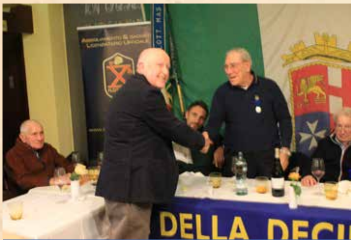
LONIGO RITIRA IL DISTINTIVO D'ONORE