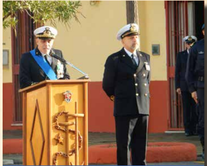
IL NUOVO COM.TE DEL COMSUBIN ED IL C.S.M.